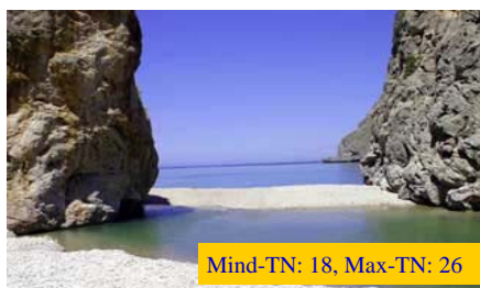
Mind-TN: 18, Max-TN: 26

Abenteuerlich ist die Strasse, die 800 m tief zur Bucht von Calobra hinabführt, und am Ende in den großartigen Canyon Torrent de Pareis übergeht. Weiterfahrt durch das Tramuntanagebirge zum Kloster Lluc . Besuch der Wallfahrtskirche, die auf eine 61 cm hohe Marienstatue zurückgeht und an der auch Antonio Gaudi mitgearbeitet hat. Weiter über Pollenca mit dem berühmten Kalvarienberg zur 15 km ins Meer hineinragenden Halbinsel Formentor , den landschaftlichen Höhepunkt, den sich das Tramuntanagebirge bis zum äußersten Ende hier für uns aufgehoben hat.